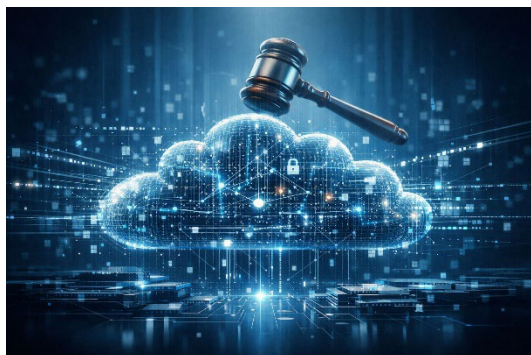
Symbolische Darstellung von Cloud-Computing und rechtlicher Regulierung, KI-generiert

Consist Software Solutions GmbH A Consist World Group Company