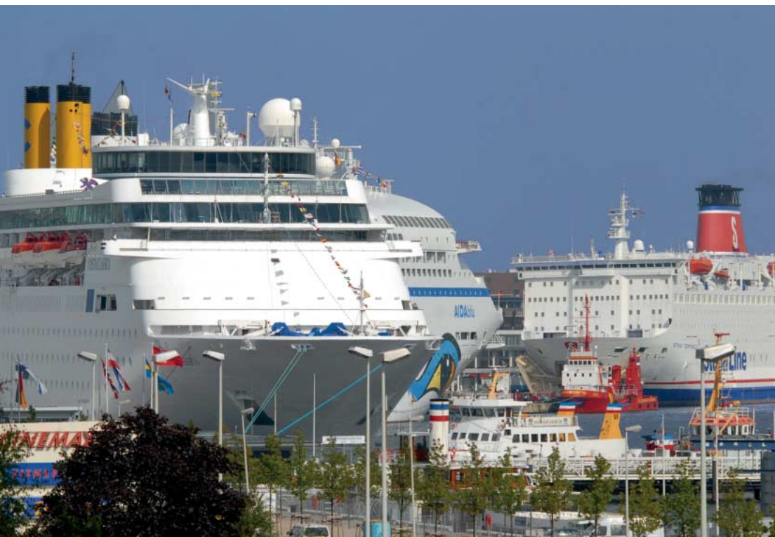
Kreuzfahrer im Kieler Hafen

Kiel ist Treffpunkt für Kreuzfahrtschiffe aus aller Welt